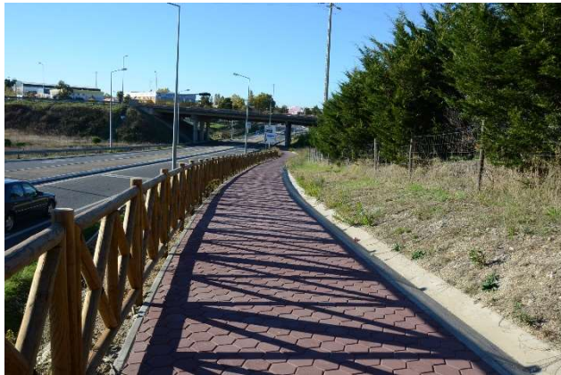
Eixo Pedonal Estruturante da Mobilidade Urbana (Castelo Branco)