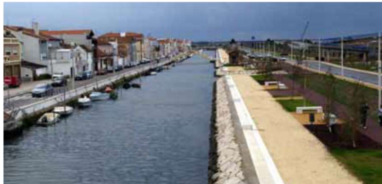
Canal de S. Roque (Aveiro)