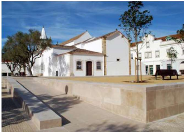
Largo Wellington (Torres Vedras)