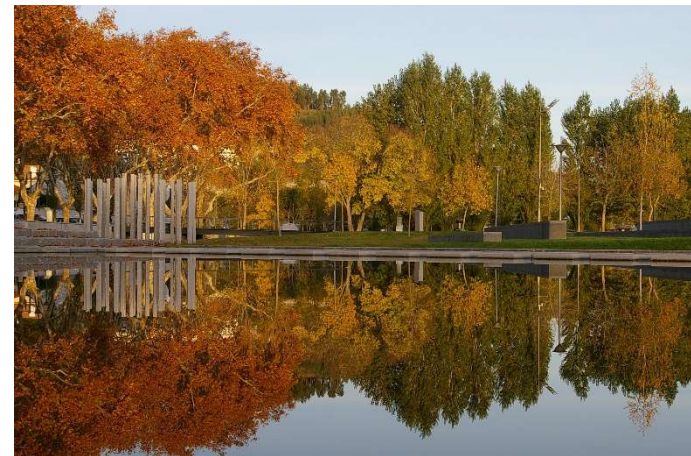
Parque das Estátuas (Vila Nova da Barquinha)