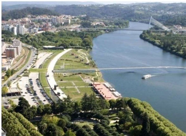
Parque Verde da Cidade (Coimbra)