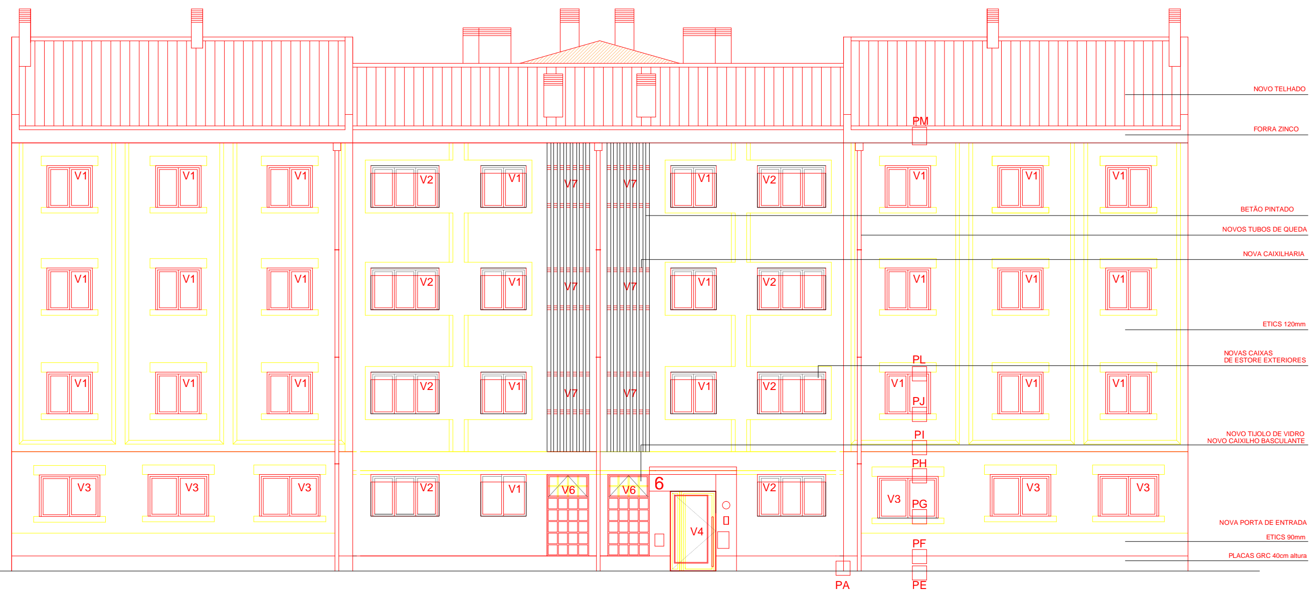
ALÇADO PRINCIPAL BLOCOS 6/29/30